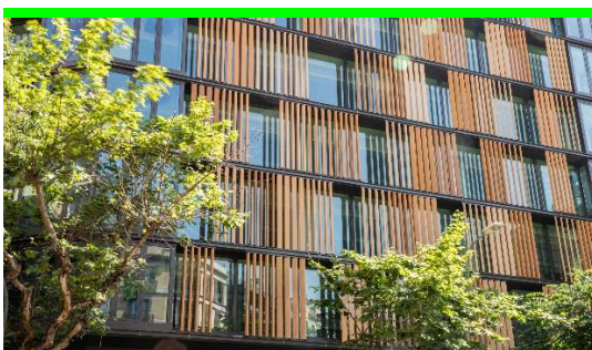
Nou Campus 2 (Provença 216)

EADA Business School , va ser creada el 1957 per un grup d'empresaris i professionals com a institució independent tant des del punt de vista ideològic com econòmic. A més d'aparèixer als reconeguts rànquings internacionals del Financial Times o The Economist, disposa de l'acreditació EQUIS que concedeix l'EFMD (European Foundation for Management Development), així com l'AMBA que reconeix la qualitat dels programes MBA.